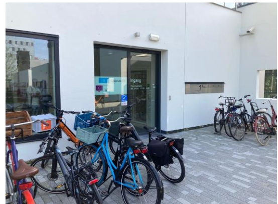
Ingang ‘C’ van het Science

LET OP: Locatie is veranderd! Entree is vanuit parkeerplaats achter hoogbouw. Toegang tot parkeerplaats is m.b.v. rijbewijs.