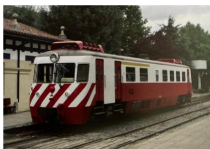
CP 9301 Allan

Het museum heeft twee rijvaardige stoomlocomotieven. Met een van deze stoomlocjes met bijbehorende wagons reed onze groep naar het stationnetje van Lasao en terug. Ook heeft het museum een in 1954 door het Rotterdamse Allan gebouwde motorwagen CP 9301 die nog steeds rijvaardig is. In de vijftiger jaren is uw reisorganisator vele malen langs deze fabriek gefietst aan de Kleiweg, nietsvermoedend dat hij deze motorwagen nog eens in Azpeitia zou tegen komen.