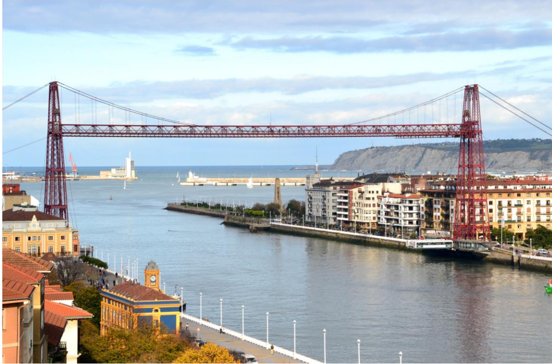
Puente Viskaya / Puente Colgante

Bijna 2/3 van onze deelnemers waren op eigen gelegenheid naar Bilbao gereisd. Samen met de leden die gebruik hadden gemaakt van de KLM-vlucht die de reiscommissaris georganiseerd had, werd verzameld in de hotellobby. Aansluitend werd tegenover ons hotel ingescheept op de boot die ons over de rivier de Nervion naar het icoon van onze reis, de eerste zweefbrug ter wereld die gebouwd is.