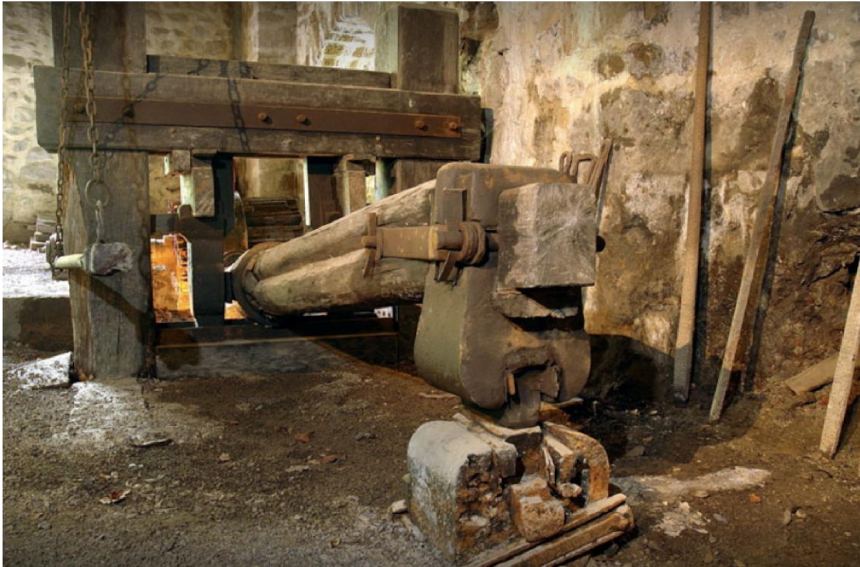
De grote hamer

El Pobal, een 500 jaar oude smelterij, gieterij en smederij, is de enige van alle oude gieterijen in Baskenland waar een groot deel van de originele werktuigen en installaties behouden zijn gebleven.