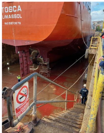
Toeziende ogen KIVI Histechica