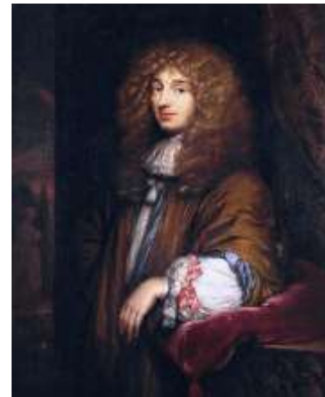
Christiaan Huygens door Caspar Netscher 1671

Entree is vanuit parkeerplaats achter hoogbouw . Toegang tot parkeerplaats is m.b.v. rijbewijs.